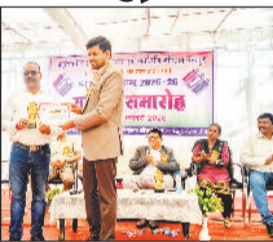
सीएमओ को मिला उत्कृष्ट कार्य के लिए सम्मान

चंद्रपुर। मतदाता सूची के विशेष संक्षिप्त पुनरीक्षण एसआईआर कार्यक्रम में विधानसभा क्षेत्र क्रमांक 36 चंद्रपुर ने छत्तीसगढ़ राज्य में दूसरा स्थान हासिल कर महत्वपूर्ण उपलब्धि प्राप्त की है। इस सफलता के उपलक्ष्य में डभरा के स्वामी आत्मानंद विद्यालय परिसर में भव्य सम्मान समारोह का आयोजन किया गया।