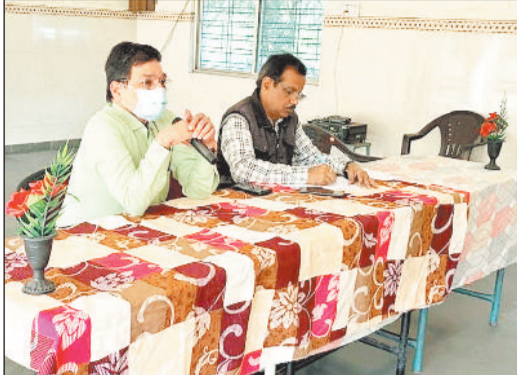
बैठक में स्कूलों के शिक्षकों को जानकारी देते अधिकारी।

समीक्षा बैठक में सभी अशासकीय शालाओं के प्राचार्यों को निर्देशित किया गया कि माध्यमिक शिक्षा मंडल से संबद्ध